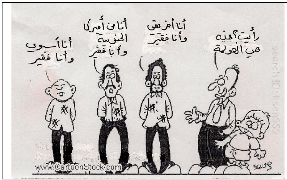
مستند رقم -3-